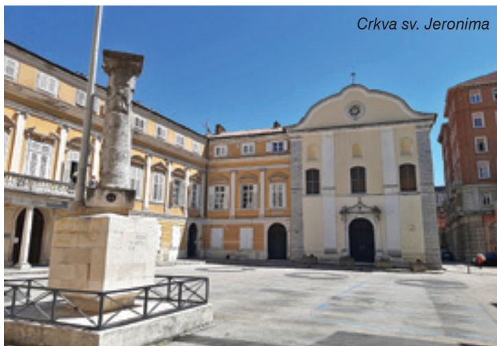
Crkva sv. Jeronima

Stube kojima se hodočasnici stoljećima uspinju do crkve Gospe Trsatske, nose ime Petra Kružića koji ih je dao sagraditi. Branitelj Klisa, utvrde iznad Splita koja je od turskih nadiranja čuvala južnu Hrvatsku, poginuo je 1537. godine. Bio je jedan od najvećih junaka u hrvatskoj povijesti. Osmanlije su mu odrubile glavu nakon presudne bitke za klišku utvrdu, te su je prodale njegovoj sestri Katarini. Ona je bratovu glavu sahranila u crkvi Gospe Trsatske pod oltarom sv. Petra. Na nadgrobnoj ploči u trsatskoj crkvi ispisano je latinski natpis u slavu Petra Kružića koji u prijevodu glasi: "Ova kamena ploča pokriva kosti Petra Kružića, kojega Turci, jao, pogubiše. Dok je on bio živ, Senj i Klis nikada se ne bojahu Turaka. Zemlja uzelo njegovo tijelo, nebo dušu, a njegovo junaštvo raznosi po svijetu neumrla slava." Ovaj je natpis bio postavljen na Kružićev grob poslije njegove pogibije 1537., a danas uz tu nadgrobnu ploču stoji i drugi latinski natpis novijeg datuma: "Ovdje položena čuva se glava preslavnog kliškog viteza Petra Kružića, + 1537."