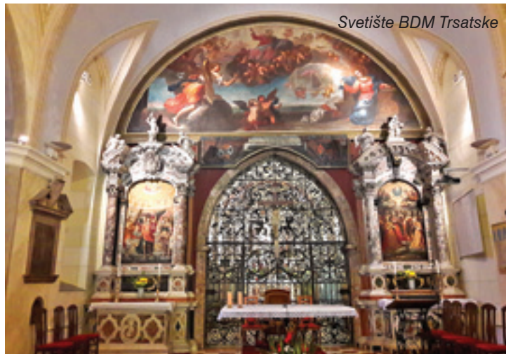
Svetište BDM Trsatske