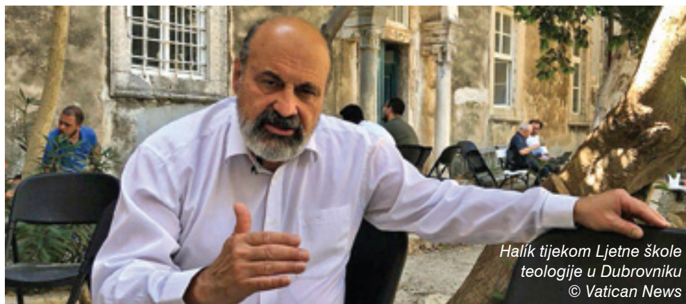
Halík tijekom Ljetne škole teologije u Dubrovniku

Crkva je kao zajednica hodočasnika živi organizam, što znači da treba uvijek biti otvorena, mijenjati se i razvijati. Sinodalnost, zajednički hod (syn hodos), znači stalnu otvorenost Božjemu Duhu, po kojem uskrsli, živi Krist živi i djeluje u Crkvi. Sinoda je prilika da zajedno slušamo što Duh danas govori Crkvama.