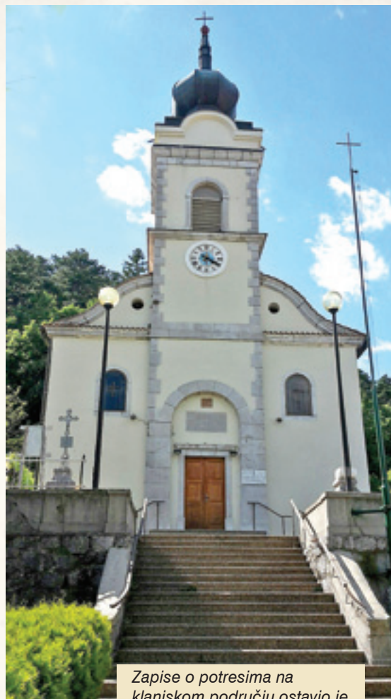
Zapise o potresima na klanjskom području ostavio je narodni preporoditelj, hrvatski ban Matko Laginja (1852.-1930.)

Veliki potres koncem 1750. godine promijenio je lice Rijeke, koja se od srednjovjekovnog gradića opasanog bedemima počela pretvarati u značajnu luku i širiti nasipavanjem morskoga žala. Magnituda glavnog potresa, pretpostavljaju seizmolozi, bila je 5,7 s epicentrom u neposrednoj blizini Bakra.