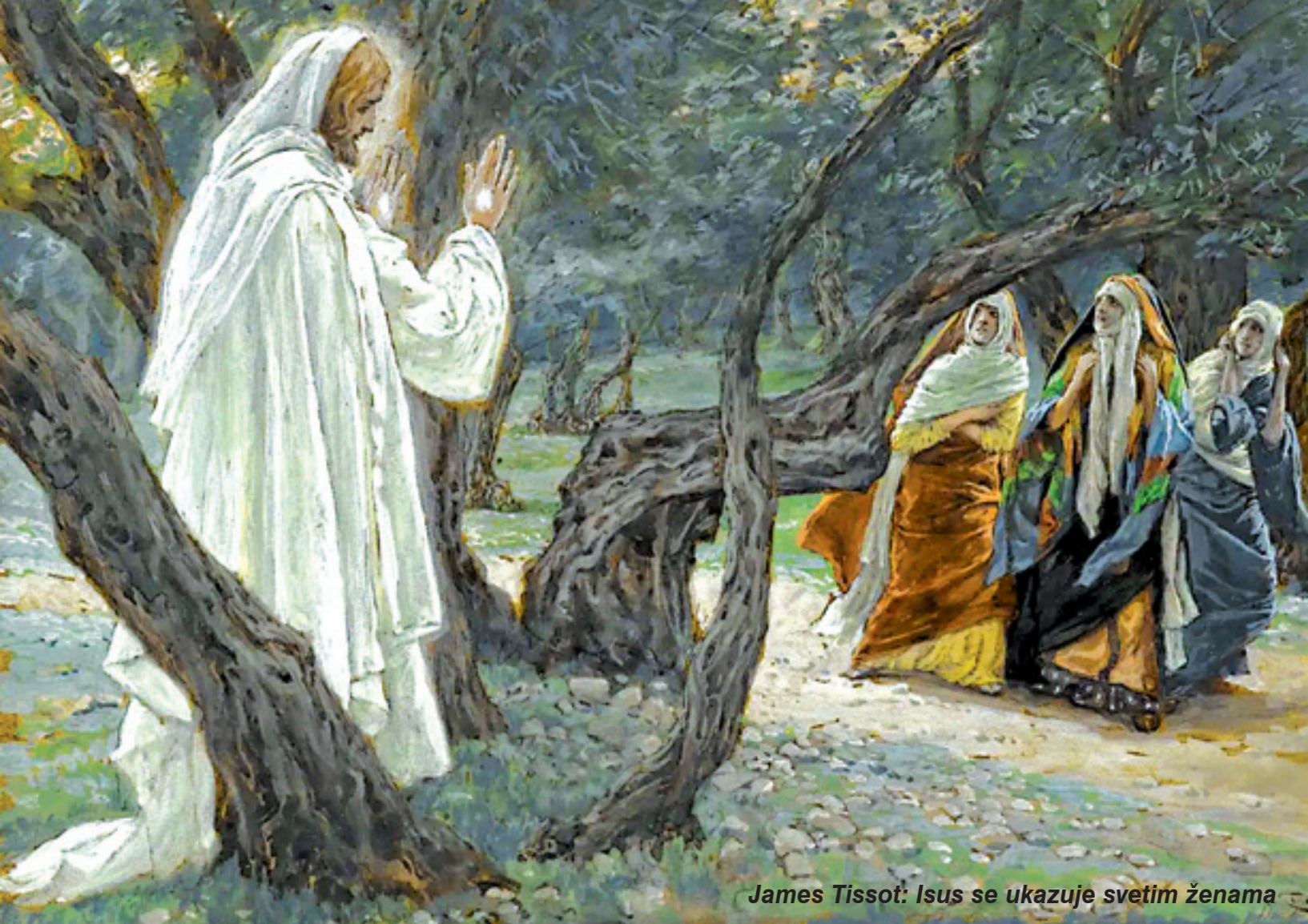
James Tissot: Isus se ukazuje svetim ženama

Uskrsna poruka riječkog nadbiskupa Mate Uznića Ide pred vama u Galileju. Ondje ćete ga vidjeti. (Mt 28, 7)