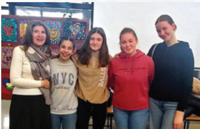
Prva sušačka hrvatska gimnazija