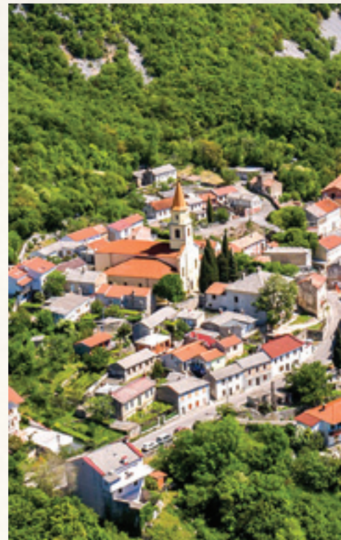
Crkva sv. Andrije u Bakru srušena je u potresu 1750. Svoj današnji izgled treća po veličini crkva u Hrvatskoj, a od nje su monumentalnije samo zagrebačka prvostolnica i đakovačka katedrala, dobila je tek 1852. godine