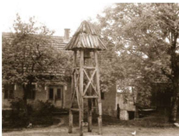
Zvonik u kutima