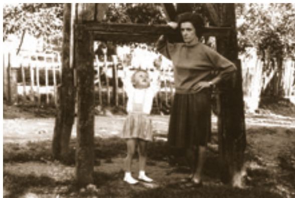
Zvonik i autorica teksta s majkom

Zvonar je morao i održavati zvonik i povremeno ga okrećiti zaštitnom bojom. S posebnom pažnjom skrbio je i o zvonu. On