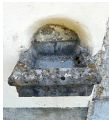
Sv. Rok, Brod Moravice