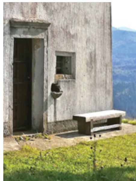
Sv. Andrija, Gornji Kuti