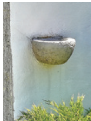
Sv. Trojstvo, Čedanaj

Škaubice se u brodmoravičkom kraju razlikuju veličinom i oblikom. To su manje, polukružne, ovalne ili četvrtaste kamen posude debelih stjenki, obično bez natpisa i s minimalnim ukrasima (izbočene ili užljebljene trake) na obodu. Ovdje donosimo nekoliko fotografija takvih jednostavnih škaubica . One često pokazuju sudbinu same kapele pa crkve koje su tijekom svog vijeka pretrpjele devastaciju i sada imaju oštećene ili odlomljene škaubice , čak i onda kad je građevina poslije obnovljena i posvećena, pa danas funkcionira kao sakralni objekt. Takva škaubica jasno pokazuje povijest svoje crkve svima koji to žele i znaju iščitati pa nam je utoliko značajnija.