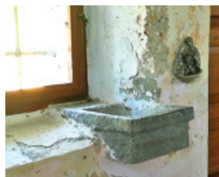
Sv. Josip, Stari Lazi