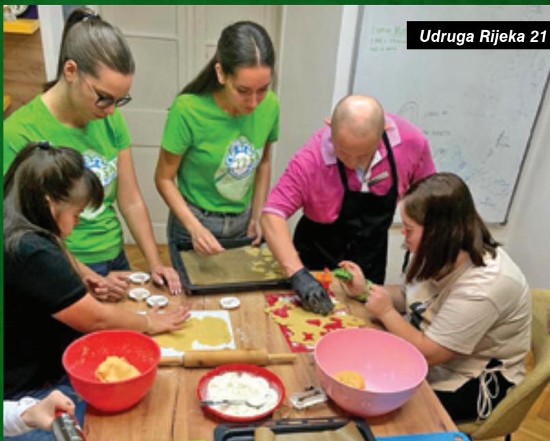
Udruga Rijeka 21