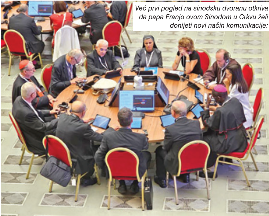
Već prvi pogled na sinodsku dvoranu otkriva da papa Franjo ovom Sinodom u Crkvu želi donijeti novi način komunikacije: