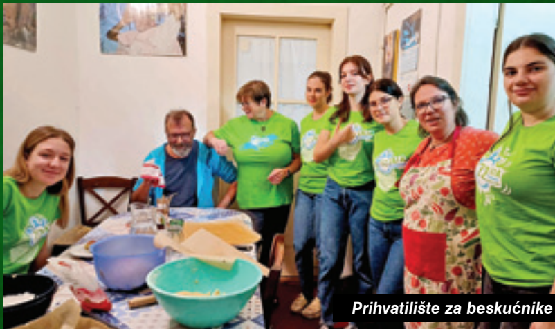
Prihvatilište za beskućnike