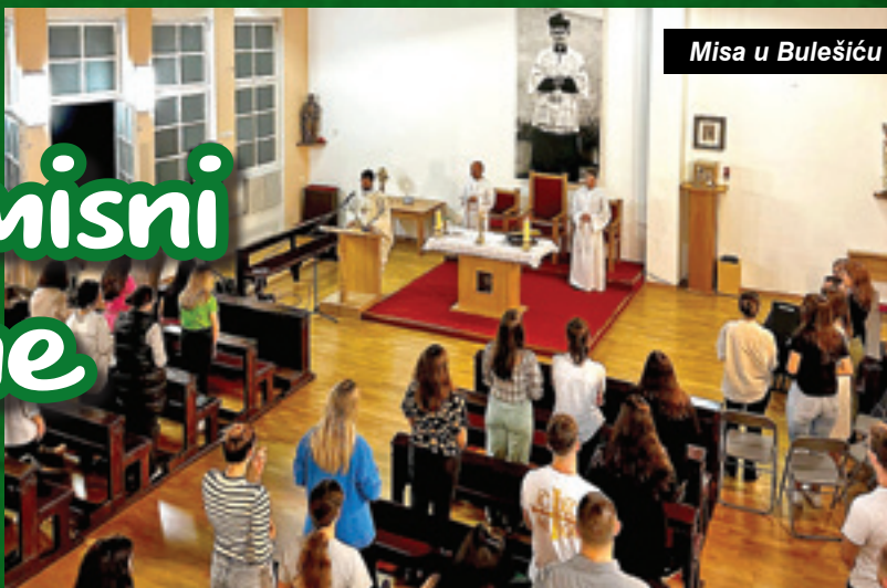
Misa u Bulešiću

Pozvao je mlade i sve okupljene da budu dio Isusovog plana, a njegov plan je radost i spasenje svih. Iz nedjeljnog evanđelja istaknuo je poruku da Kraljevstvo Božje nije isključivo projekt za budućnost, nego za sadašnjost. „Ne trebamo čekati Kraljevstvo Božje, nego ga moramo izgrađivati“, rekao je nadbiskup objasnivši kako to znači propovijedati kao Isus, ali i činiti ono što je Isus činio. Nedjeljno evanđelje, prisposobom o kraljevoj svadbi, ukazuje kako ljudi odbijaju poziv u Kraljevstvo Božje zbog svojih planova i interesa. „Učiniti za druge ono što možemo učiniti. Ne biti egoističan, nego se darovati u ljubavi braći i sestrama, to je Kraljevstvo Božje. Ovo što ste vi činili u protekla 72 sata najbolji je izraz kako to činiti.“