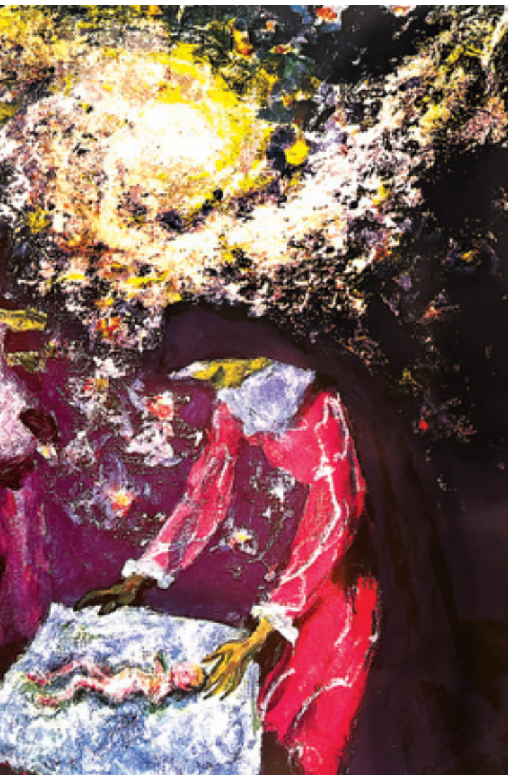
Ivo Dulčić (1916-1975.), jedan od najvećih hrvatskih i europskih slikara, u svom sakralnom opusu polazi upravo od vidljive kristološke stvarnosti

Božjeg rađanja i njegove naklonosti čovjeku, prikazana je istovremeno i kao vrtložno kretanje i kao zaustavljena prisutnost. Upućuje na ostvarenu puninu vremena, na središnji događaj stvorene povijesti: Svjetlo je ishodište vremena i prostora.