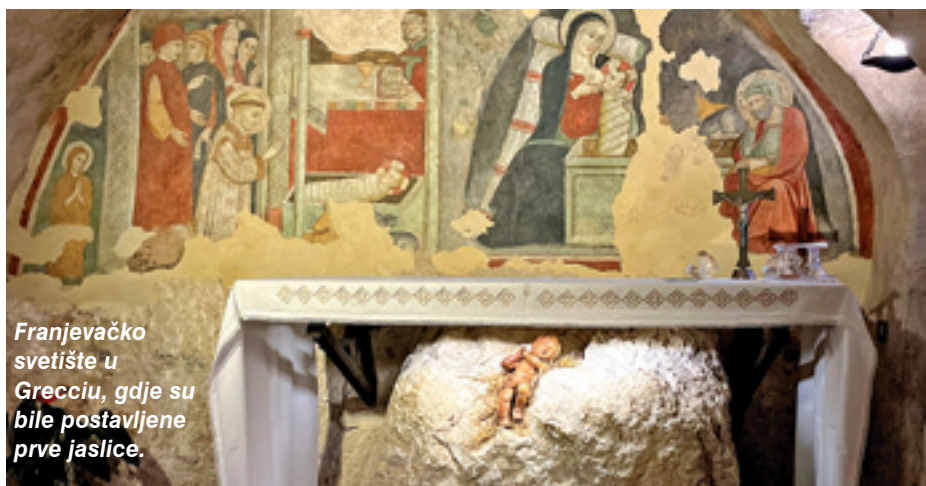
Franjevačko svetište u Grecciu, gdje su bile postavljene prve jaslice.

U malenom mjestu Greccio, u blizini gradića Rieti, 1223. godine, sv. Franjo Asiški postavio je, prvi put u povijesti, žive jaslice, o čemu svjedoče zapisi Tome Čelanskog: Franjo je petnaestak dana prije Božića pozvao k sebi plemenitog Ivana, i rekao mu: „Želio bih obnoviti uspomenu na ono Dijete, koje je rođeno u Betlehemu, i na njegove djetinje potrebe i neprilike tj. kako je bilo smješteno u jaslice i položeno na slamu u nazočnosti vola i magarca da bi se to moglo tjelesnim očima gledati“. Tjelesnim je očima bilo potrebno zorno prikazati scenu Isusova rođenja, da bi je bolje shvatili, ulazeći u bolnu istinu okolnosti Isusova rođenja.