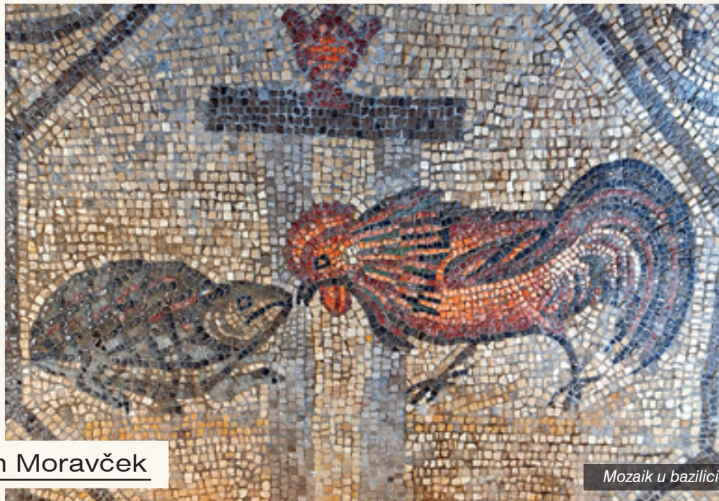
Mozaik u bazilici

Dnevno crkveno-upravno područje sa sjedištem u Akvileji, danas gradiću od svega 3500 stanovnika u talijanskoj Furlaniji, imalo je središnju ulogu u kršćanskoj, ali i političkoj povijesti područja današnje zapadne Hrvatske. Akvilejska biskupija, koja je postala patrijarhatom 568. godine, imala je ključnu ulogu u pokrštavanju dijelova današnje Riječke nadbiskupije, Istre i drugih krajeva Hrvatske. Ne samo crkveno, već i gospodarsko moćni, akvilejski patrijarsi imali su kovnicu novca te su raspolagali znatnim dobrima što im je omogućilo da postanu feudalni gospodari Istre, Furlanije i Kranjske.