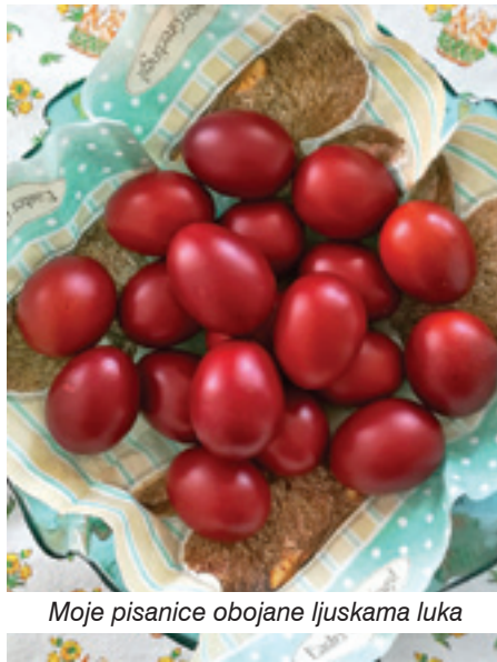
Moje pisanice obojane ljuskama luka

O pisanicama se puno zna, ali ipak ćemo se prisjetiti bojanja jaja. Nekoć, kad nije bilo industrijskih boja, domaćice su jaja bojale bojama iz prirode – korom breze, ciklom i ljuskama crvenog luka. Ova je zadnja metoda bila i najomiljenija jer je davala najljepše rezultate. Danas se