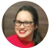
Piše: Daria Ljevar

Ako uskrsnuti znači ustati, mogli bismo pomisliti da je priča ovdje gotova jer to činimo svaki dan, nekoliko puta. Zašto je onda ovo ustajanje toliko drugačije?