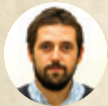
Piše: Tomislav Zečević

Prvi izričit spomen uskrsnuća nalazimo u grčkom prijevodu Knjige proroka Daniela u kontekstu posljednjega suda: „Tada će se probuditi mnogi koji snivaju u prahu zemljinu; jedni za život vječni, drugi za sramotu, za vječnu gadost“ (Dn 12,2).