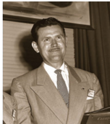
Frank Kurtis, fotografija iz IMS Museuma

Osim za potrebe utrka, Kurtis je nakon Drugog svjetskog rata redizajnirao i automobile ondašnjega jet-seta. Tipske je limuzine maštovitim dodatcima tzv. „agresivna dizajna” pretvarao u unikatna prestižna vozila visoke estetike, po čemu je bio poznat u filmskom svijetu. Stoga se smatra dizajnerom ne samo trkaćih nego i