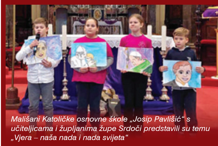
Mališani Katoličke osnovne škole „Josip Pavlišić“ s učiteljicama i župljanima župe Srdoči predstavili su temu „Vjera – naša nada i nada svijeta“