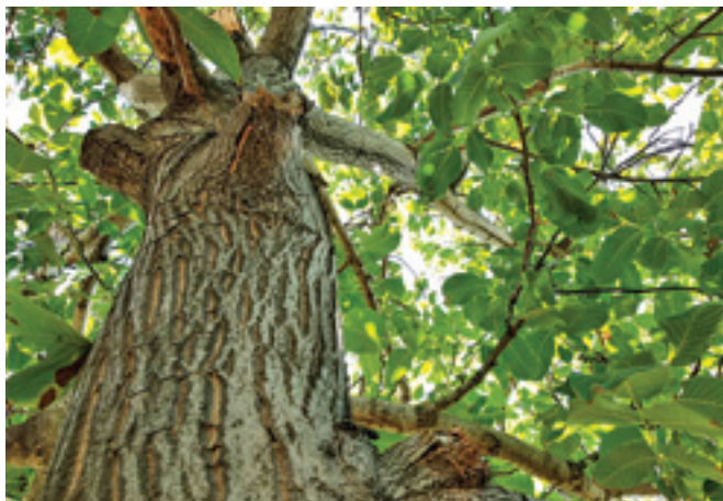
Svi poznajemo stablo oraha. A znamo li uopće kako je orah dospio k nama i kakve nam sve koristi nudi?

Istraživanja su pokazala da je plod oraha veoma hranjiv i zdrav za konzumaciju jer je bogat zdravim mastima, proteinima i vlaknima, odnosno ima vi-