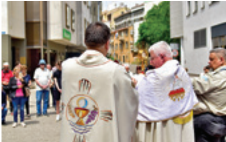
Tijelovo u Rijeci