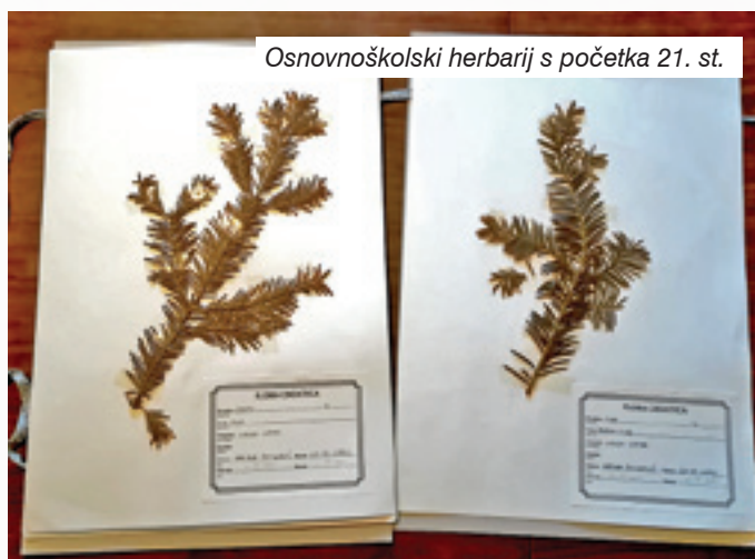
Osnovnoškolski herbarij s početka 21. st.

Zato bismo se, možda, u školama mogli opet vratiti herbariju, koji se pokazao tako jednostavnim, a višestruko korisnim učilom. Konačno, nije baš sve što smo u ime modernizacije i napretka napustili bilo baš tako jako loše.