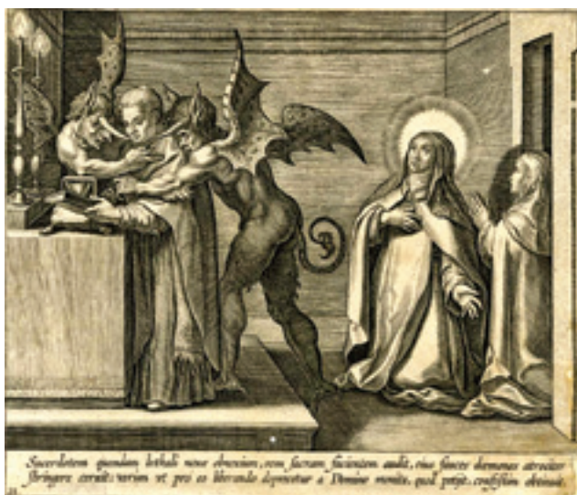
Viđenje sv. Terezije Avilske gdje vidi kako dva đavla okružuju svećenika koji slavi sv. misu u smrtnom grijehu te snagu riječi pretvorbe koja se događa i tada.

viđenje bilo od Boga, ne bi Njegovo Veličanstvo dopustilo da vidim zlo što je u onoj duši. Nato mi reče sam Gospodin, neka se molim za onoga svećenika. On je dopustio da ono vidim i da upoznam moć što je imaju riječi pretvorbe, te da Bog ne prestaje biti ondje, pa bio i najgori svećenik koji ih izgovara. Usto neka vidim njegovu veliku dobrotu, jer predaje se i u ruke svoga neprijatelja, a sve to za dobro moje i svih ljudi. Shvatih dobro da su svećenici kudikamo više dužni da budu dobri nego drugi; kako je strašno primati Presveti Sakrament nedostojno te koliko đavao gospodari duši kad je u smrtnom grijehu. To mi viđenje učini vrlo veliku korist i učini da spoznam što dugujem Bogu. Hvala mu dovijeka. Amen.“