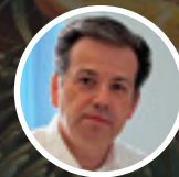
Priredio: Ivan Host

Predblagdansko i blagdansko raspoloženje donosi nam radost, ljubav i veselje, ali nekima i stres i nezadovoljstvo. Kako bismo Božić i Novu godinu ipak proveli u pozitivnom emotivnom raspoloženju, evo nekoliko savjeta koji nam mogu pomoći.