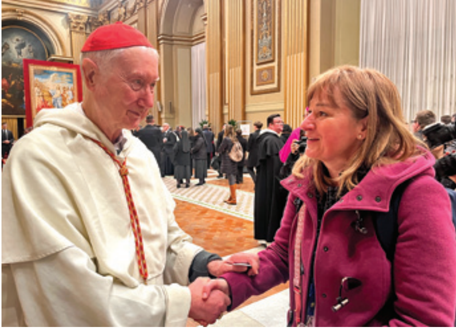
U razgovoru s našom novinarkom kardinal Timothy Radcliffe, dominikanac, rekao je da bi karizmatični lider budućnosti trebao svakako biti – ponizan.