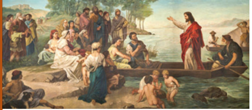
Isus podučava iz Šimunove lađe, Nepoznati umjetnik, Sv. Marija Uznesenja, Marietta, Ohio, Sjedinjene Američke Države

Osobito se za krštenje, prvu pričest, krizmu i vjenčanje nastoji oraspoložiti vjernike za dostojno i djelatno primanje tih sakramenata. To je razumljivo jer Bog nas ne spašava automatski ili protiv naše volje, nego uz našu suradnju.