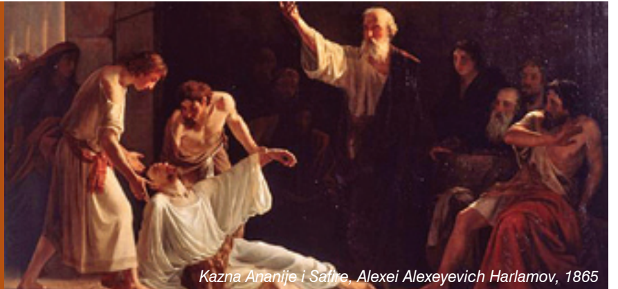
Kazna Ananije i Safire, Alexei Alexeyevich Harlamov, 1865

Zašto sakramenti ne djeluju? Zato što, iako primljeni, nisu zaživjeli. Nisu našli plodno tlo. Osoba samo prima sakrament, ali plodovi sakramenta ostaju zamrznuti u potenciji. Ako se kasnije vrati životu vjere, oni oživljuju.