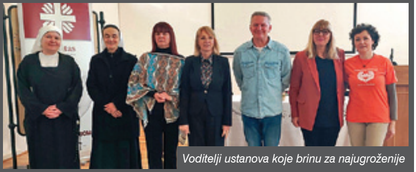
Voditelji ustanova koje brinu za najugroženije

U prostorima Caritasa Riječke nadbiskupije 11. prosinca održana je konferencija za novinare na kojoj su se okupili predstavnici karitativnih ustanova koje djeluju na području Riječke nadbiskupije i brinu o siromašnima, beskućnicima te ženama i djeci žrtvama obiteljskog nasilja, kao i zdravstveno-karitativnih ustanova čiji je osnivač Caritas Riječke nadbiskupije.