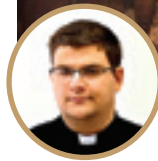
Piše: Goran Žan Lebović Casalonga

je, bez zlopamćenja, mržnje i osvete. Budućnost osvjetljena praštanjem omogućuje nam tumačiti prošlost drukčijim, vedrijim očima, iako vlažnima od suza.