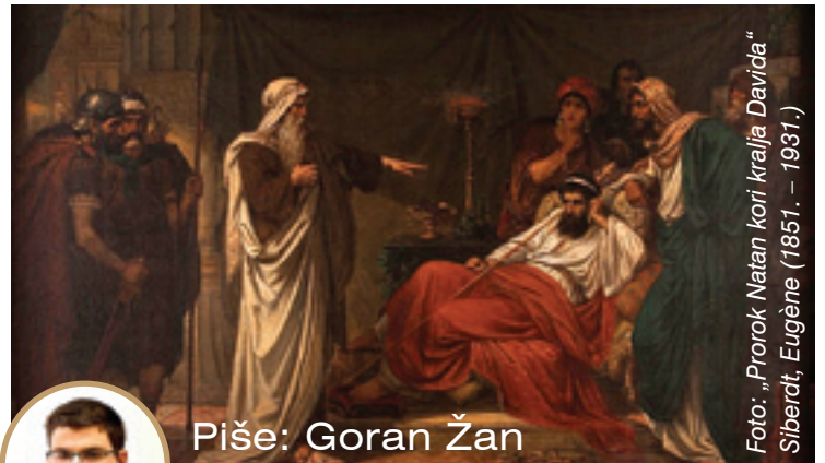
Foto: „Prorok Natan kori kralja Davida.“ Siberdt, Eugène (1851. – 1931.)

U buli ovogodišnjeg Jubileja papa Franjo nam piše: Oprost nam, naime, omogućuje otkriti koliko je Božje milosrđe bezgranično. Nije slučajno što se u davna vremena pojam milosrđe slobodno zamjenjivalo pojmom oprost, upravo zato što se njime želi izraziti punina Božjeg oprost, koja ne poznaje granice. Zatim nastavlja: Sakrament pokore jamči nam da Bog briše naše grijeh. No, kao što znamo iz vlastita iskustva, grijeh ostavlja trag, ima posljedice: ne samo vanjske, u smislu posljedica počinjenog zla, već i unutarnje, u smislu da „svaki grijeh, pa i laki, povlači sa sobom nezdravu privrženost uz stvaranja, koju treba čistiti bilo na ovoj zemlji bilo poslije smrti u stanju zvanom čistilište“. U našem slabom i zlu sklonom čovječstvu ostaju, dakle, posljedice grijeha. One se uklanjaju oprostima, opet zahvaljujući Kristovoj milosti, koja je, kao što je napisao sveti Pavao VI. [...] Iskustvo oprostjenja neizbježno otvara srce i um praštanju. Praštanje ne mijenja prošlost, ne može promijeniti ono što se već dogodilo. Ipak, praštanje nam može omogućiti da promijenimo budućnost i živimo drukči-