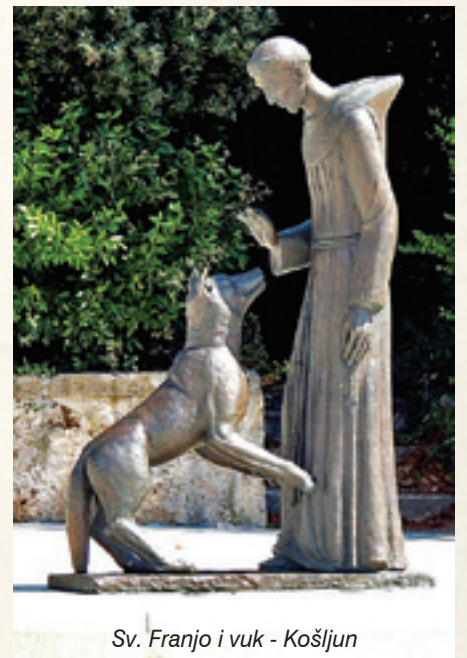
Sv. Franjo i vuk - Košljun

u Modruš te je modruškim biskupom imenovan 4. lipnja 1460. godine. Pio II. preminuo je 1464. godine, a njegova zamisao o križarskom ratu protiv Osmanlija potpuno je napuštena te se biskupsko područje kojim je upravljao Franjo Modrušanin Stipković našlo u još većoj pogibelji.