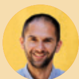
Piše: Marko Medved

nu. Nerijetko, osobito neradnim danima, prisustvujem razgovorima između osoba lišenih slobode i njihove rodbine koja, nadvikujući se, komunicira s voljenim osobama iza rešetaka. Te su me scene nekoć skandalizirale. No Papa mi je 26. prosinca, otvarajući jubilejska vrata u zatvoru Rebibbia, koji je prozvao „drugom bazilikom“, ustvari otvorio oči rekavši u odgovoru novinarima da su „velike ribe na slobodi“.