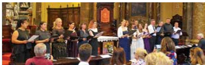
„Koncert za mir“ uz operne soliste i instrumentaliste