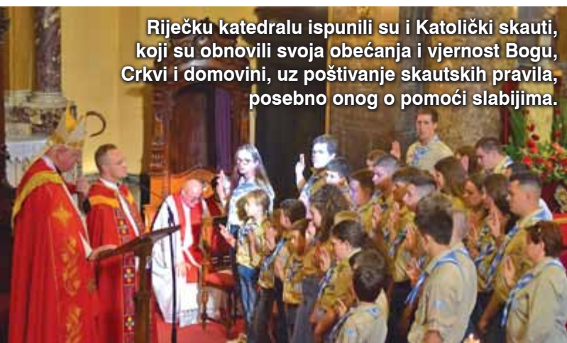
Riječku katedralu ispunili su i Katolički skauti, koji su obnovili svoja obećanja i vjernost Bogu, Crkvi i domovini, uz poštivanje skautskih pravila, posebno onog o pomoći slabijima.

P ropovijed je započeo prisjećanjem na prošlogodišnje slavlje stogodišnjeg riječkog jubileja kada je misu svetkovine sv. Vida predvodio izaslanik pape Lava XIV., predsjednik Talijanske biskupske konferencije kardinal Matteo Zuppi. Kardinal je tada poručio da kršćanstvo nije religija straha od Boga nego vjera povjerenja u Boga koji ljubi te pozvao na odbacivanje podjela među ljudima. „Isusova ljubav ne dopušta da zlo postane posljednja riječ o čovjeku, da strah bude temelj naših odnosa i da mržnja određuje naše pamćenje, naše odluke i našu budućnost“, objasnio je nadbiskup Uzinić. „Ipak, kad počnemo sumnjati u tu Božju ljubav, gubimo povjerenje u Boga i njegov plan s nama. Iz toga se rađa strah od drugih, osobito od onih koji su drugačiji od nas, koji ne pripadaju našoj zajednici, ne dijele našu vjeru i ne razumiju naše poslanje onako kako ga mi razumijemo. Tada nam drugi lako postaje prijatna, a od onih koji bi nam mogli biti prijatelji, braća i sestre, stvaramo neprijatelje. I naposljetku, počinjemo sumnjati i u sebe, u smisao svoga postojanja, u mogućnost dobra, u vlastitu sposobnost da ljubimo, opraštamo, služimo i budemo sretni.“