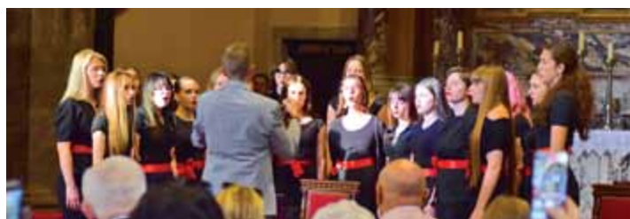
Glazbena škola I. M. Ronjgov

U Danima sv. Vida ove godine u ponudi je bio bogat program događanja koja nisu liturgijska. Održan je znanstveni skup o povijesti Crkve na području Riječke nadbiskupije te znanstveni susret u katedrali sv. Vida uz podsjećanje na sakralnu i umjetničku baštinu riječke katedrale. Održana su i tri vrhunska glazbena doživljaja, a sve je započelo 6. lipnja u Art kinu projekcijom filma po izboru nadbiskupa Mate Uzinića.